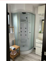
1階シャワールーム