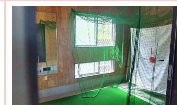
1階室内多目的に利用出来ます。

※この図面はATBBの物件情報の一部を抜粋して掲載しております。(現況優先) ※入居日・引渡日変更や付帯条件、別途料金が発生する場合がありますのでご確認ください。