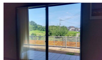
1階リビングからの眺め