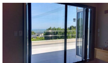
2階洋室からテラスへ